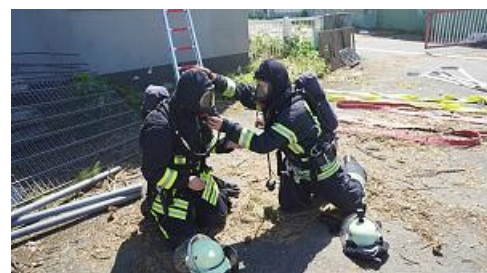
Stadt Bad Nauheim

Feuerwehr Rödgen übt auf dem Stoll-Gelände